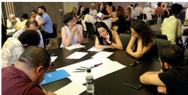
Workshop INVESTMED mid-term event à Barcelone