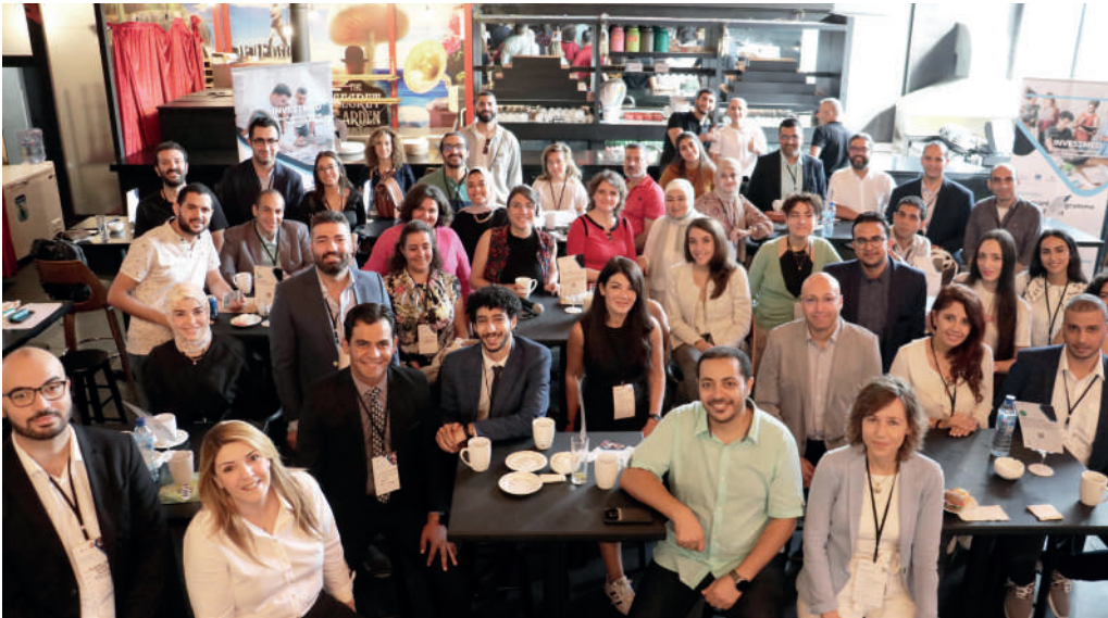
INVESTMED (photo de groupe)

D'ici 2030, le monde devra créer environ 600 millions d'emplois pour répondre à la croissance de la population active mondiale. Les PME, générant plus de la moitié de l'emploi mondial, et contribuant presque à hauteur de 40% du PIB dans les économies émergentes, selon les données de la Banque mondiale, occupent alors une place centrale dans l'agenda de nombreux gouvernements à travers la planète.