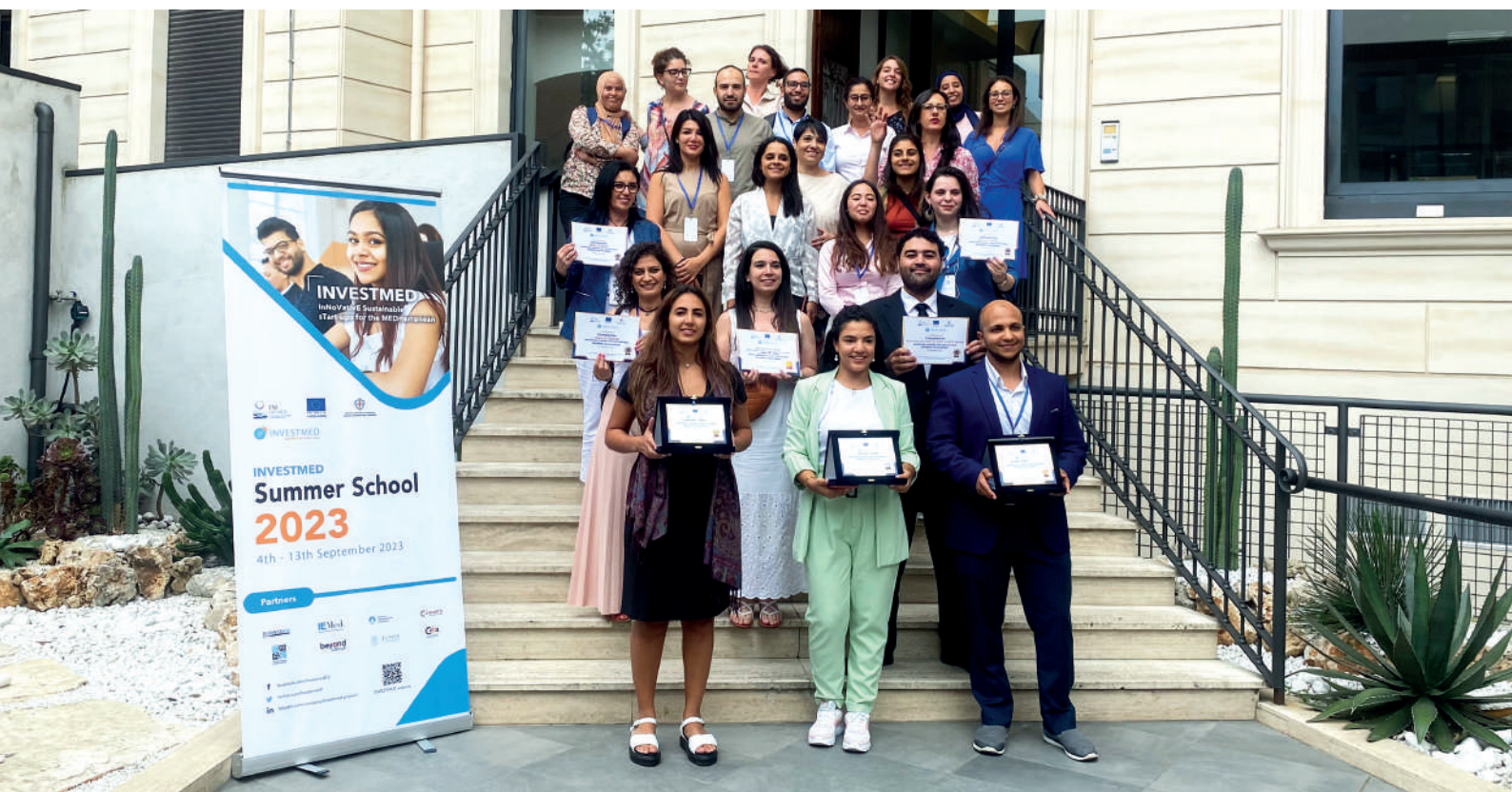
INVESTMED Summer School

Les micro, petites et moyennes entreprises méditerranéennes sont confrontées à des défis de compétitivité, de durabilité, d'internationalisation et d'innovation. Pour assurer leur croissance et leur pérennité, elles cherchent activement de nouvelles solutions. Parallèlement, la transition vers une économie plus respectueuse de l'environnement et l'exploitation des ressources naturelles offrent des opportunités économiques et environnementales considérables pour la région méditerranéenne.