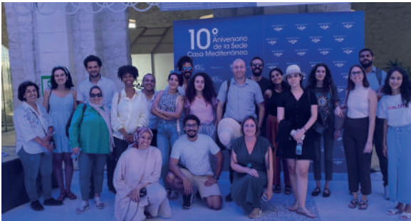
Mobility Visits Casa Med

re et la production alimentaire, la réduction des émissions de CO2, la musique et la danse, le cinéma, les arts et l'artisanat, la littérature, l'architecture, le tourisme et la recherche sur la durabilité. Les